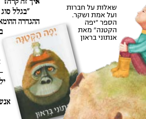
שאלות על חברות ועל אמת ושקר. הספר "מה הקטנה" מאת אנתוני בראון

"השאלות נוקשות ברלת שלהם מדי פעם. כשילד אומר לי: 'אבל למה אנחנו חיים בכלל?', לא אני שתלתי לו את השאלה הזו בראש. השאלה הזו מצניקה לו לעצור את החשיבה הפילוסופית, את התהיות ואת היאלוג, זה לבגוד באמון של הילדים בנו, וזה חלק מאוד מרכזי מהאופן שבו הם חיים"