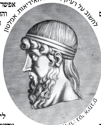
חשוב על רעיון מתורת האריאיות אפלטון

מבחינת סדן, החשיבה הפילוסופית אינה פעולה שאדם עושה לבדו, אלא היא תמיד משותפת. "כש'למדתי' לתואר ראשון באוניברסיטת תל-אביב, אחד המרצים