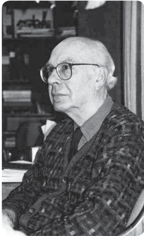
עידוד חשיבה ביקורתית תכין לחיים בוגרים. מתוך ליפמן

< אבל אני לא מתערכת, הכול בא מהם". האם כשאת מלמדת את משלבת את התייחסות למושגים פילוסופיים של הוגים מסוימים?