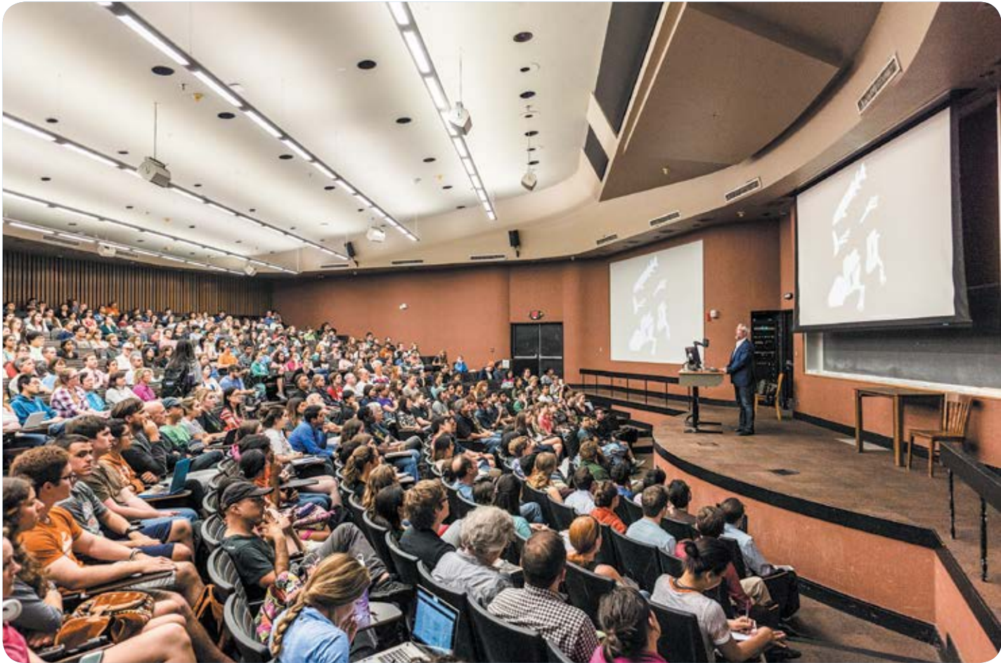
מיומנויות החשיבה לוקות בחסר. הרצאה באוניברסיטה

"בגלל סוג המפגש הזה. אחת ההגדרות של דיאלוג, ההגדרה ההומאנית, היא שהדיאלוג הוא מפגש עם אנשים במלואם, עם כל האישיות שלהם, עם כל הניואנסים. במפגשים פילוסופיים זה ברור כלל לא כך. עם ילדים, לעומת זאת, אני מרגישה שאני פוגשת אנשים במלואם – ובמקרה הזה הם גם ילדים. פילוסופיה עם ילדים היא מפגש בין חשיבה וקריבה. יש משהו מקסים בלהקשיב לאופן שבו אנשים חושבים על הדברים המהותיים בחיים