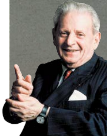
פילוסופיה כחכמה האהבה. עמנואל לוינס

"מדדים איך ילדים שיעד לפני חודשים היו בגן מאמצים חשיבה אחרת לגמרי ברגע שהם מגיעים לכיתה א'. הילד מקבל ילקוט, אומרים לו שהוא הולך ללמוד, ויש שולחן וכיסא וחוברות עבודה. זה שמעשע ומעצב, כי מה זה אומר על מה שהיה עד עכשיו בגן לא לומדים?"